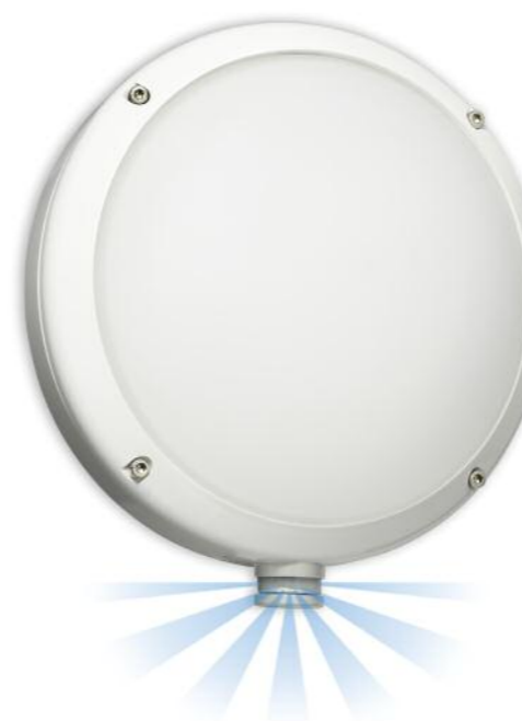
L 330 S