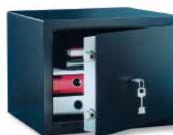
H 1 S