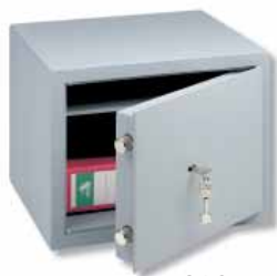
C 1 S