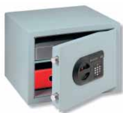
C 1 E

Serrure de sécurité à double panneton, certifiée ECB-S d'après EN 1300 classe A, avec 2 clés, 9 gorges, 1.000.000 de fermetures différentes