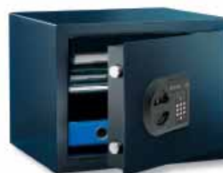
H 1 E

Serrure électronique 'SecuTronic', certifiée ECB-S d'après EN 1300 classe B. 1.000.000 de combinaisons possibles. 3 piles LR 03 AAA incluses. L'armature de serrure dépasse de 13 mm.