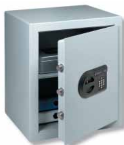
C 4 E

Serrure électronique "SecuTronic", certifiée ECB-S d'après EN 1300 classe B. 1.000.000 de combinaisons possibles. L'armature de serrure dépasse de 13 mm. 3 piles LR03 AAA incluses.